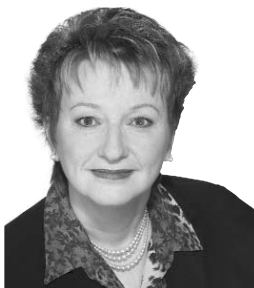
France Bonsant Députée Compton-Stanstead

C'est un honneur et un privilège pour moi de représenter mes concitoyens et concitoyennes de Compton à la chambre des Communes. Merci de votre confiance.