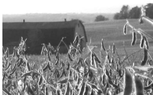
Le soya se réchauffe