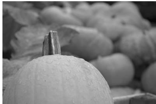
Larmes de citrouille